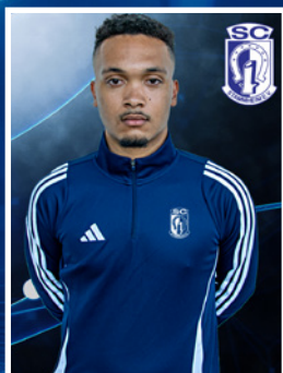
Prince Roy Uguwu