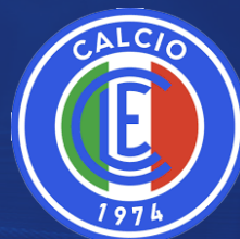
Calcio Leinfelden-Echterdingen II